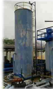
OBRA: REPARACIÓN A SKIMM TANK ESTACIÓN LA GLORIA

Hemos venido desarrollando proyectos de infraestructura en la región, con amplio conocimiento de las necesidades y requerimientos de nuestros clientes. Nuestros trabajos desarrollados tanto en el sector público como privado van desde proyectos de estructuras, construcción de gaviones, construcción de alcantarillas, construcción de puentes con estructuras metálicas, escenarios deportivos (obra civil y metalmecánica), adecuaciones arquitectónicas, instalación de cerramientos, construcción e instalación de puertas y ventanas; por lo tanto ponemos a su disposición la trayectoria profesional de nuestro grupo de trabajo, el cual tiene un compromiso social con el área de influencia de los proyectos de su compañía.